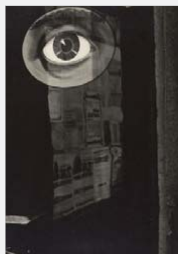
Jaromír Funke, 1932