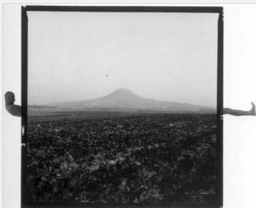
Miro Švolík – České středomoří, 1995

Osobnosť slovenskej fotografie Miro Švolík zmaturoval na SUP v roku 1979, pokračoval na FAMU (1987). Jeho fotografickú tvorbu možno chápať ako inscenovanú, „ charakterizovanú bohatou fantáziou, originálnou nápaditosťou a optimistickou recesiou. Snímky aranžovaných zoskupení často desiatok ľudských postáv dopĺňa niekedy kresbou a malbou. “ (Hlaváč, 1989) Švolík ma za sebou mnoho výstav na Slovensku i v zahraničí. V roku 1985 získal ocenenie koncertu Deutche Leasing mladých európskych fotografov. (Hlaváč, 1989) Od roku 2007 je kurátorom Galérie Bazilika v Českých Budejoviciach.