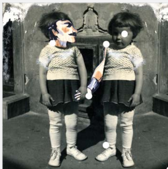
Zuzana Gronová – Obal na CD, 2008

Na výstave sa podieľal každý študijný odbor vystavením prác, ktoré mali poskytnúť komplexnú predstavu o štúdiu. Vystavené boli reprezentatívne práce z väčšiny predmetov a cvičení. Na tomto podujatí si odbor úžitkovej fotografie jednoznačne obhájil svoje miesto.