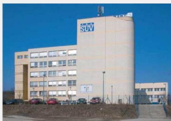
Mokrohájska, od 2000