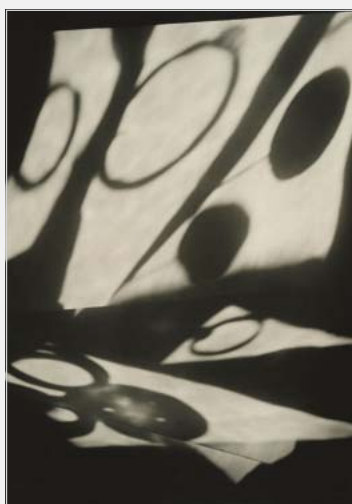
Jaromír Funke, 1928 - 1929