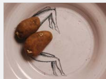
Zuzana Gronová – Fotografický dizajn, 2008

pedagogického výučbového plánu pre celé štyri roky výučby technológie.