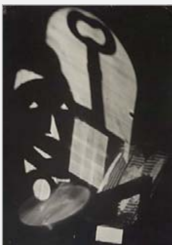
Jaromír Funke, 1927 - 1929