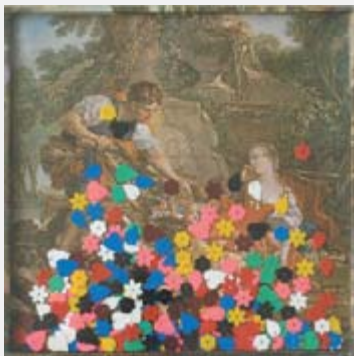
Študentská práca - Materiálová štúdia, 1990