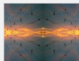
Študentské práce – Výtvarná príprava, 2008