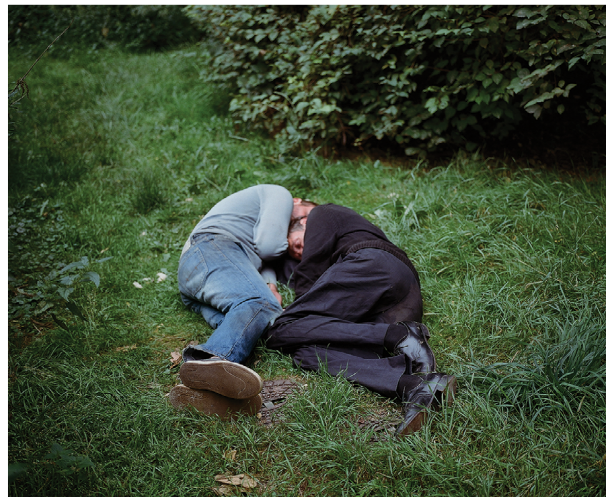
Photography: Tomasz Tyndyk, from „Garden of kings“ Series

V jistý okamžik, už během realizace tohoto projektu, jsem pocítil, že je jakoby trochu zneužívám. Víš, chodím si po parku, spokojený... a fotografuji lidi, kteří se možná nacházejí v nějakém