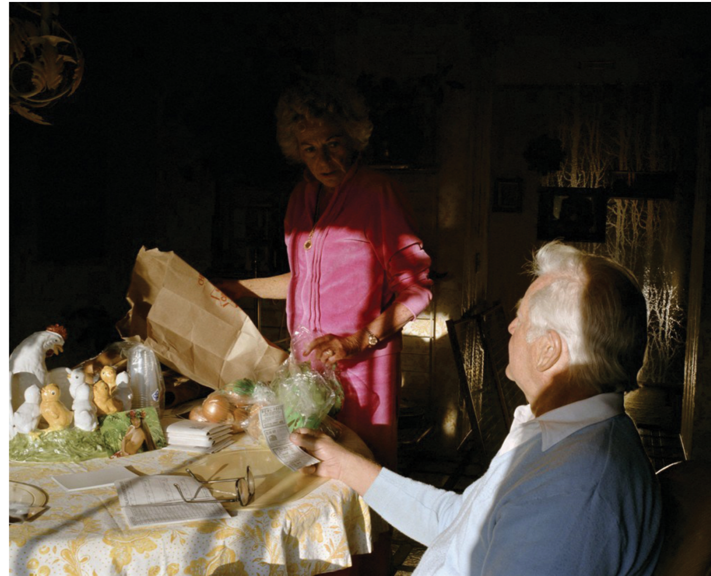
Photography: Larry Sultan, from „Pictures from Home“ Series