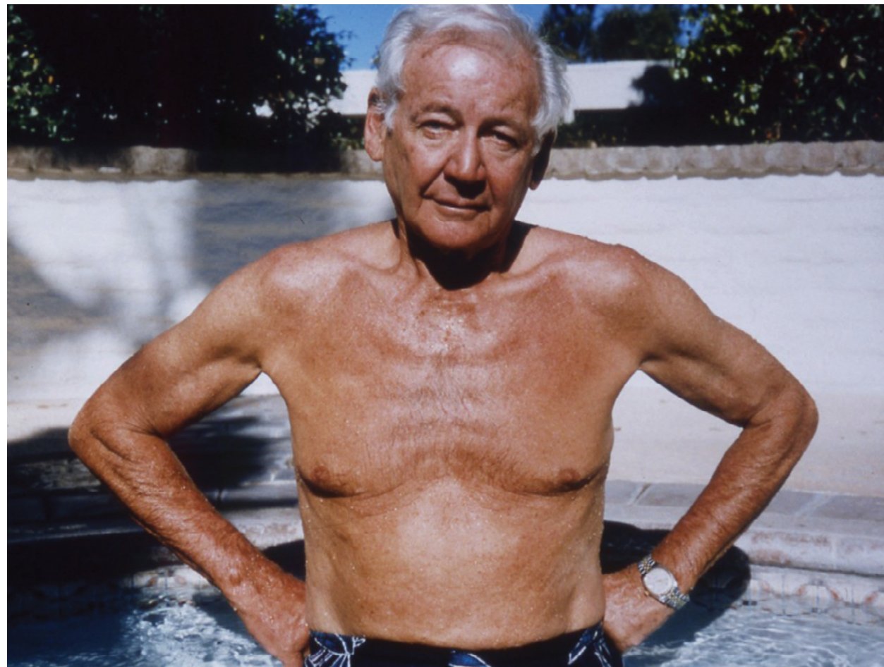
Photography: Larry Sultan, from „Pictures from Home“ Series

Během natáčení páté části filmu oba muži, což je jasně vidět, složili závěrečnou zkoušku z procesu vzájemného poznávání a uchování respektu ke své autonomii. Jejich rozhovor vytváří scénu setkání dvou zralých osobností. Protože se o tom oba zmiňují, musím uvést, že proces narovnávání jejich pošramocených vztahů ovlivnil Larryho projekt „Pictures of Home“ (publikovaný v knižní podobě v roce 1992).