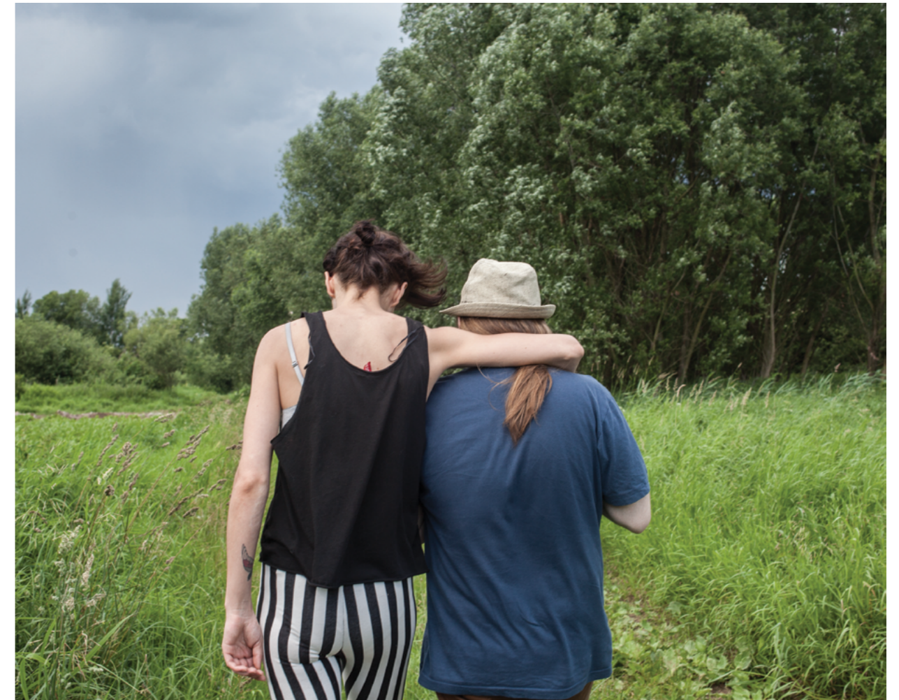
from „Returns“ Series