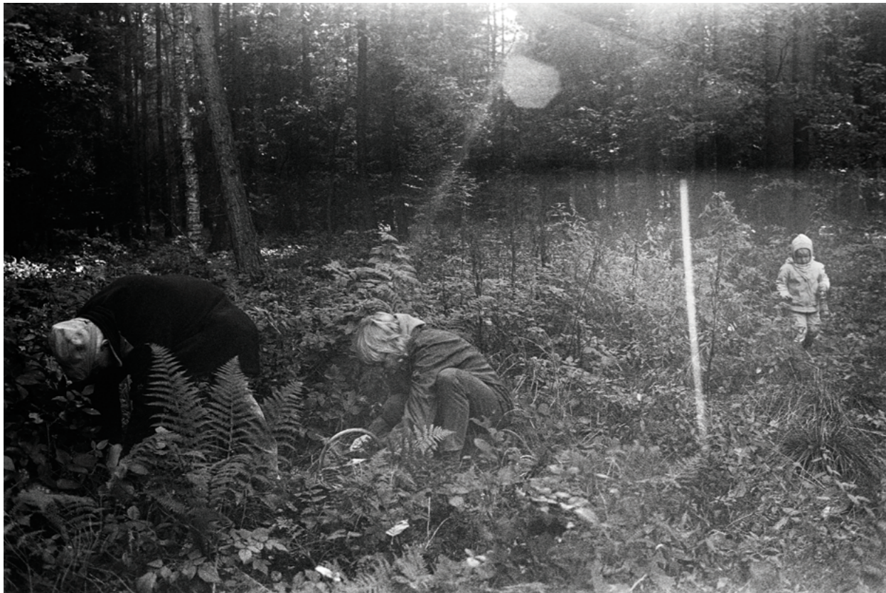
from „Province” Series

V sérii fotografií „Mamo, wróciłem na kilka dni” (Mami, na pár dní jsem se vrátil) se objevuje snímek bytu otce těsně po několikadenní pitce. Pouze jeho místo, on sám chybí. Jako v mém životě... Je tu tedy stůl, který tam stojí odjakživa, jenom občas změnil polohu. Na něm hrnek od kávy, popelník a jiné drobnosti. Lehce zamlžený pokoj. Zabírán ve stylu zátiší. Naše vztahy už byly vlastně skoro mrtvé. Navzájem jsme se vzdalovali čím dál víc. Už jsme neměli o čem mluvit, chyběla nám společná témata. Mou vášní se stala fotografie. Pohltila mě touha učit se a zdokonalovat technické postupy. Pro něj to bylo naprosto nesrozumitelné, jak jeho syn může „jen běhat a cvakat fotky”, místo toho, aby „pochtivě pracoval na opravách aut”?