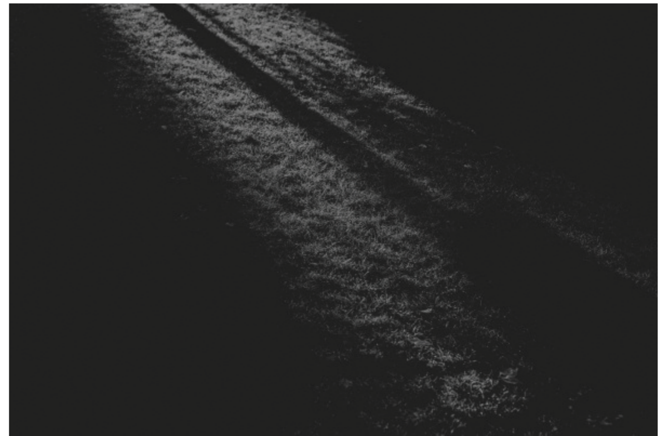
Fot. Paweł Frenczak z cyklu „Nowy początek”

K.O. : Děkuji za hovor. Přeji hodně štěstí!