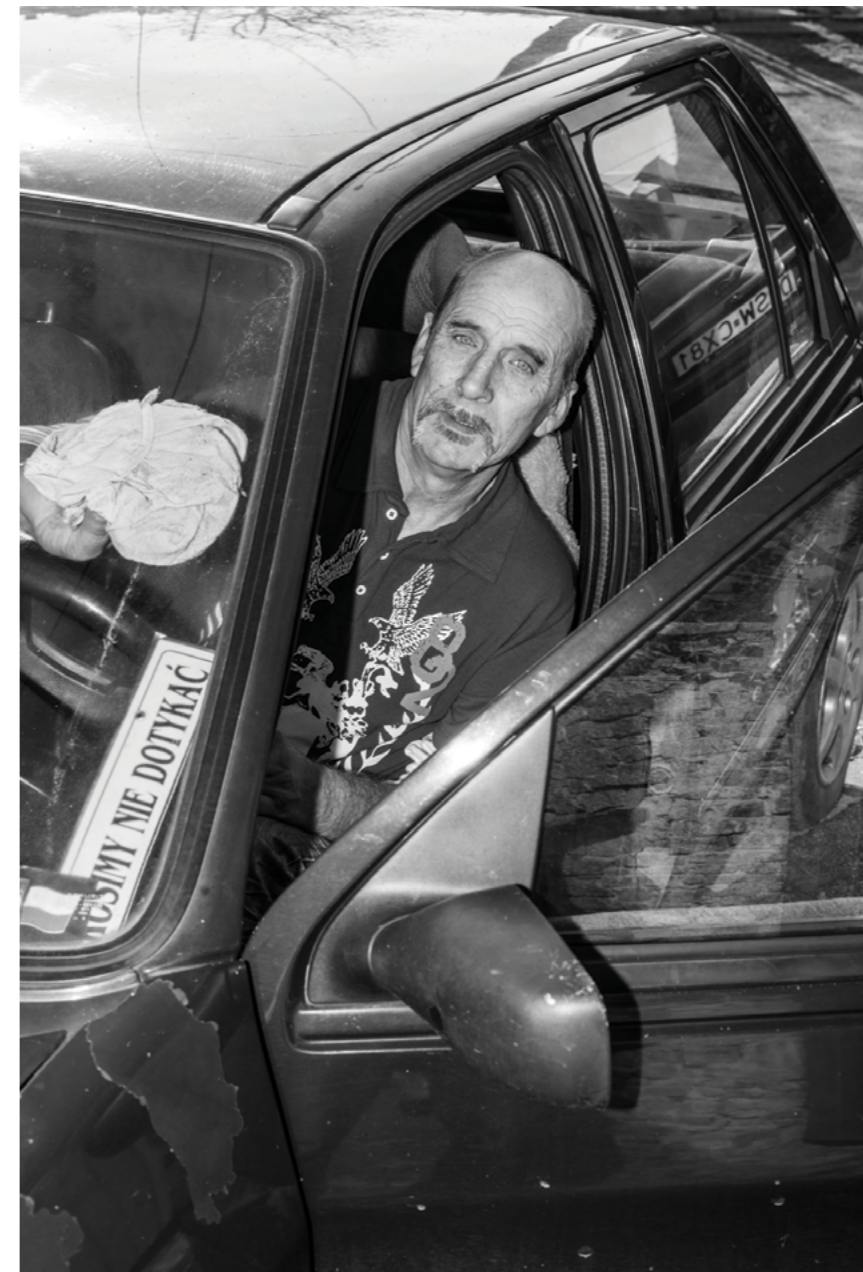
Photography: Krzysztof Orłowski, from „I'm from here“ Series

Tentokrát jsem si naplánoval scénář. Všechno bylo nevyřčené. Několik let od rozvodu už v té části města nežil, proto jsem naranžoval scénu v autě. Táta otíral zevnitř sklo, jako by chtěl smazat chyby, jichž se kdysi dopustil. Dívá se mi přímo do očí. Je to první mnou pořízená fotografie otce, která jeho postavu ukazuje takto, vidíme mimiku obličeje, vrásky a póry. Celou zátěž zkušeností velice osamělého a od společnosti odděleného člověka. Někoho, kdo opakovaně dostal šanci vrátit se zpět do rodiny, ale žádnou z nich nedokázal využít. Mého otce, s nímž jsem si nikdy nevypil skleničku vodky, s kterým jsem nehovořil o významných tématech.