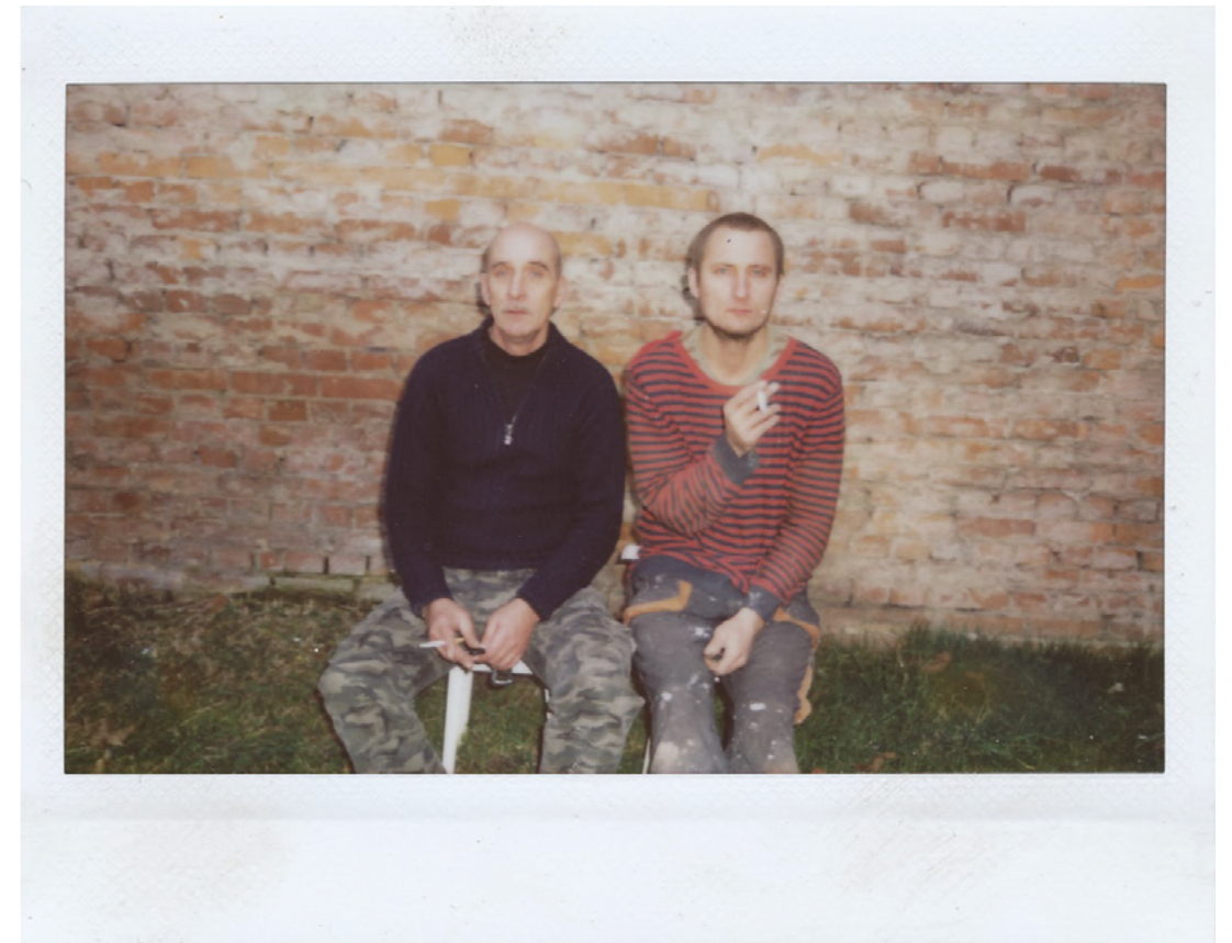
„Me and my father”

Tento komplikovaný vztah mezi námi mě zformoval takového, jakým se cítím být. Skrytého, uzavřeného v sobě, ale citlivého. Během psaní této práce jsem si položil mnoho otázek. Rád bych vážně přistupoval k poselství, že je možné, abych bezpodmínečně pochopil, že za sebe, za můj vztah k jiným a k celému světu zodpovídám pouze já. Za to, co cítím, myslím a za to, co dělám - a mimo to nic není. Mohl bych přestat pěstovat si v sobě tento smutek k otci. Tento přístup mě odděluje od úplné radosti ze života, síly a pocitu důstojnosti.