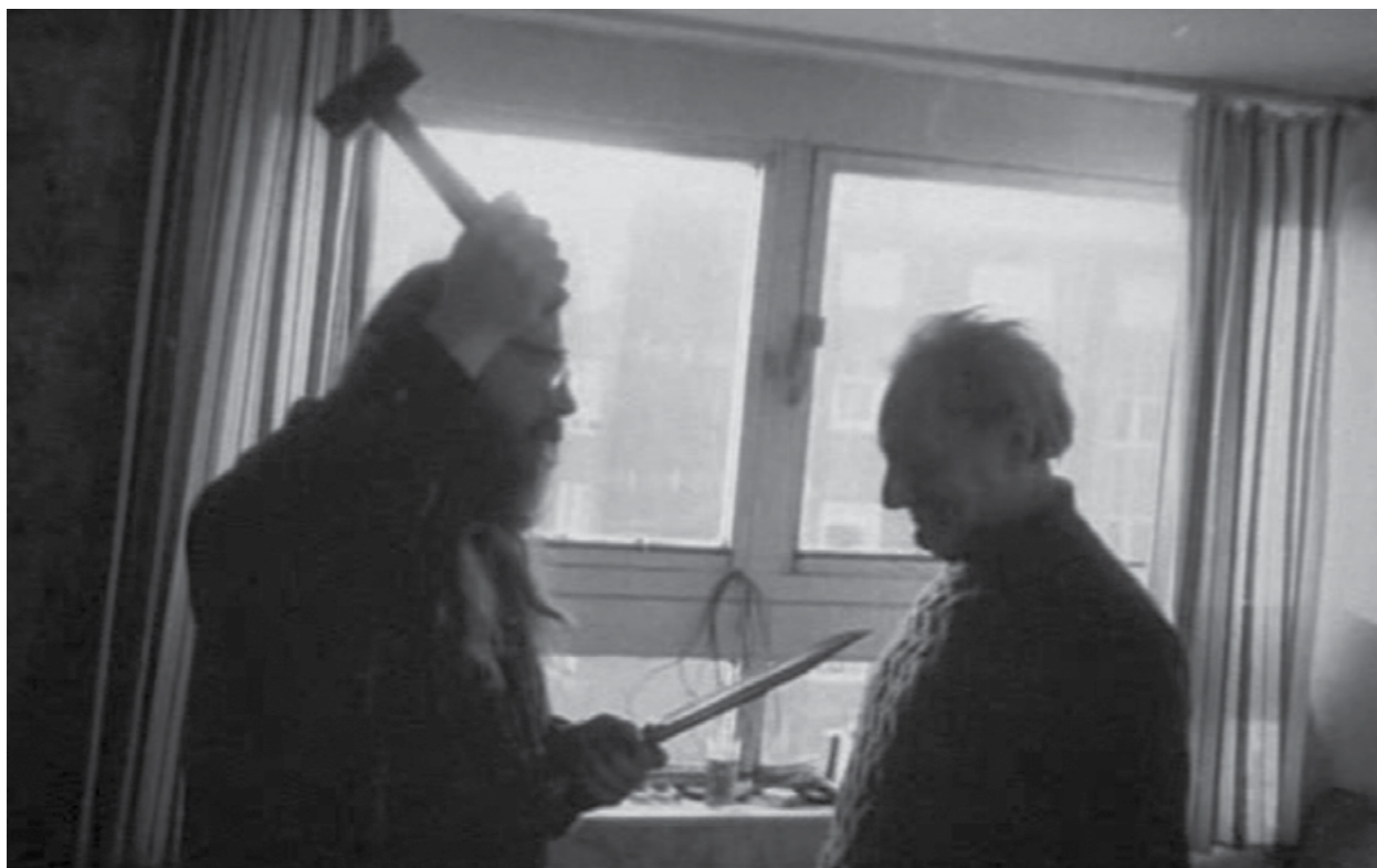
Photography: Richard Billingham, from „Ray's a Laugh“ Series

Ve filmu ukazuje první černobílé fotografie: „Tomuto chlapovi jsem říkal »psychedelický Sid«, přicházel každý den skoro jako mlékař, načerno páčil alkohol [...], díky tomu si otec mohl dovolit alkoholismus. Každý den dostával novou porci samohonky.“ I na druhém Billinghamem představeném snímku se objevuje Sid, drží v jedné ruce kladivo, v druhé nůž. Naproti stojí otec. Komentuje to: „[...] otec se nestaral o to, jestli nůž míří na něj, jestli mu na hlavu dopadne kladivo. Vyzařovala z něj slabost“. Pokračuje: „Fascinovala mě otcova samota, to, že neustále seděl v pokoji, vytvářel přitom kolem sebe psychický prostor, v němž mohl nepřetržitě pít. Chodil jen na záchod“.