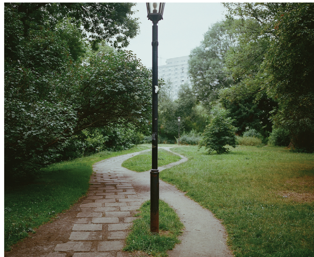
from „Garden of kings” Series