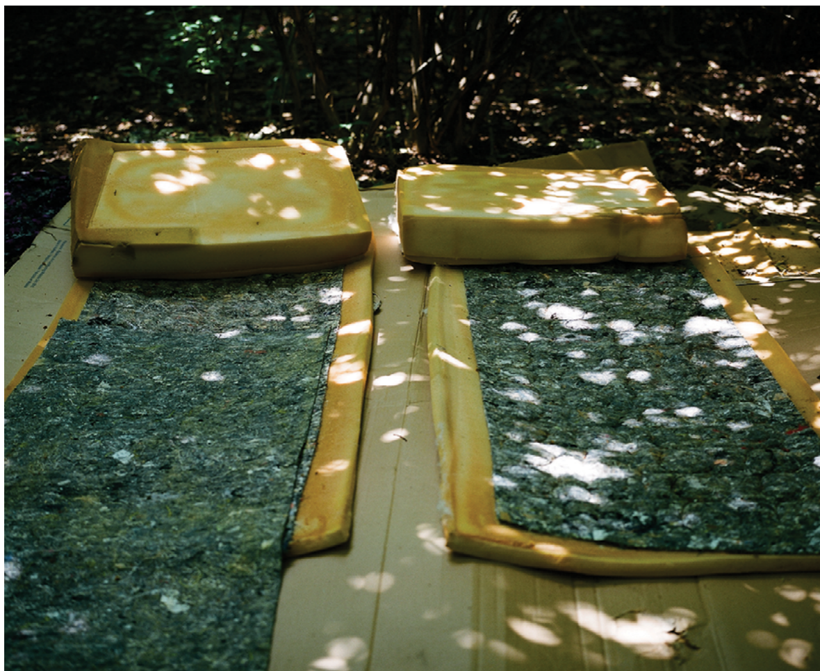
from „Garden of kings” Series

Cítím, že to ještě nevyjadřuje všechno, co jsem chtěl ukázat. Trochu z estetické, fotografické stránky. Nepochybně to pro mě bylo těžké. Samotné fotografování bylo těžké.