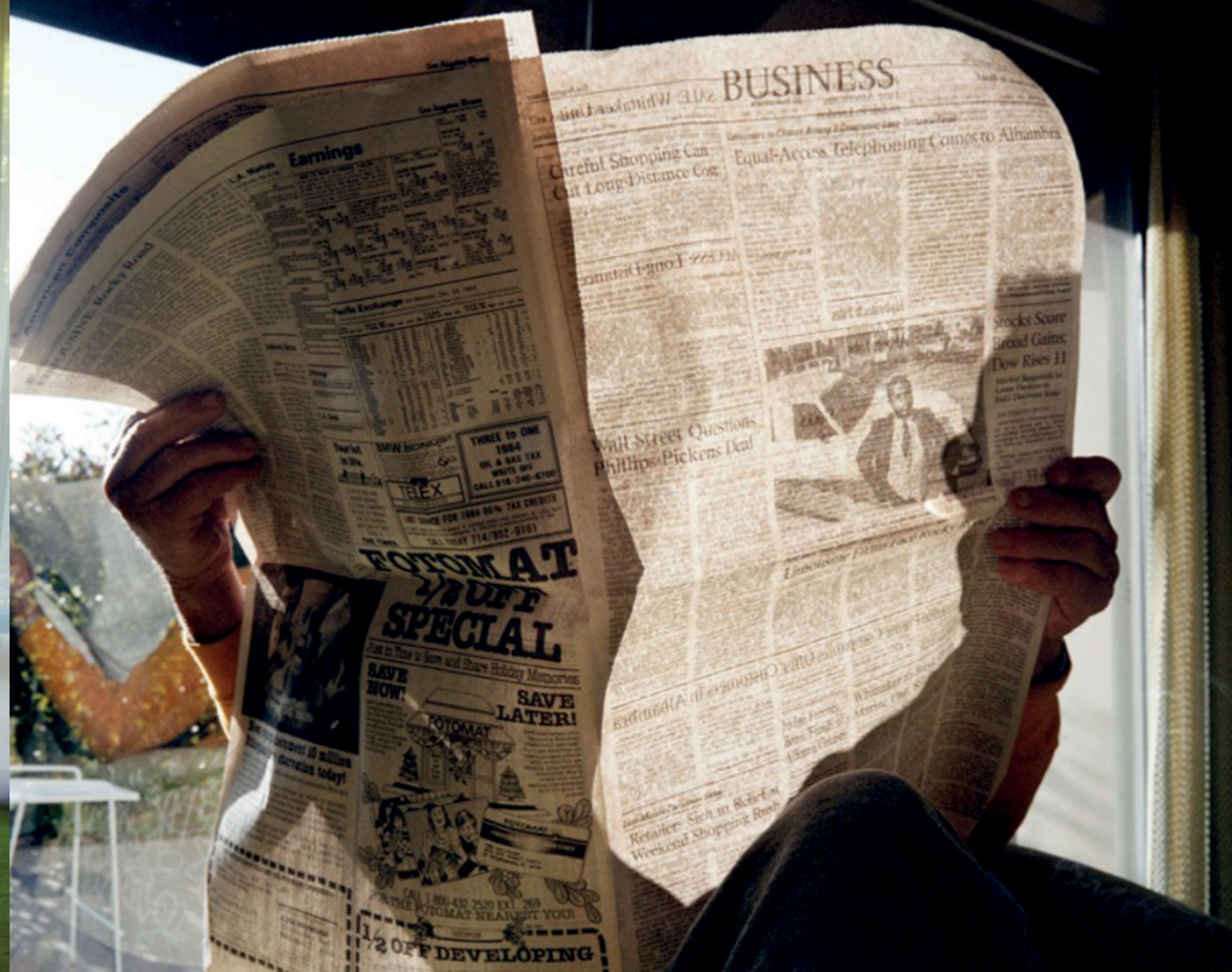
Photography: Larry Sultan, from „Pictures from Home“ Series

Projekt „Pictures of Home“ obsahuje snímky, které nejsou přísně dokumentární. Autor nefotografoval diskrétně. Přesvědčoval rodiče k pózování, vytvářel na filmu zachycenou realitu podle své umělecké vize. Komplikovalo to jejich rodinný život. Otec, jak říká vypravěč, měl potíže souhlasit s rolí, kterou mu syn určil. Irvin vypráví: „Ale musím přiznat, že mě ohromě naštvalo, když jsem si pohodlně sedl a on řekl: »Neusmívej se«. Nedokázal jsem pochopit, o co mu jde? Co ode mě očekával“. Larry to komentuje: „Nechtěl jsem, aby se kdokoliv usmíval, protože to vypadalo idiotsky. Moje fotografie měly být jiné. K těmto snímkům se to nehodilo“.