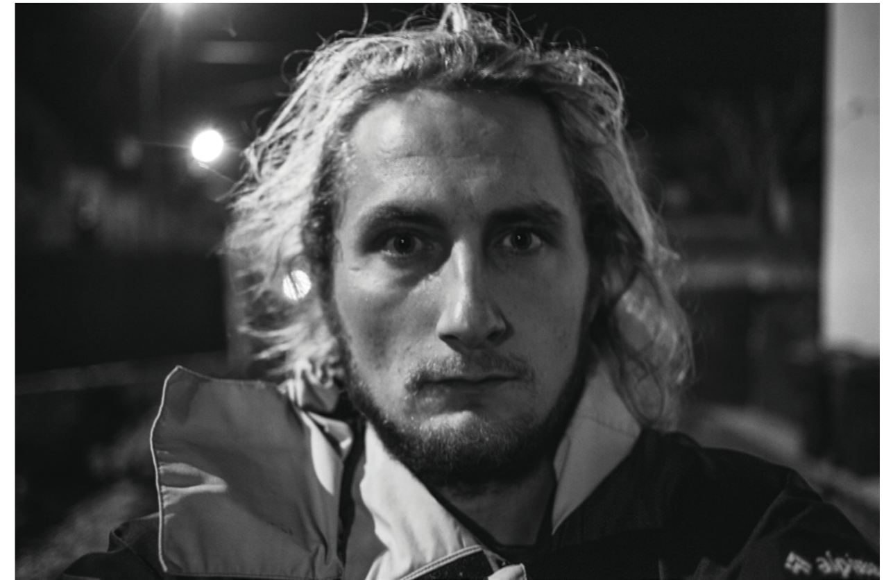
from „Mam, I came back home for a couple of days” Series