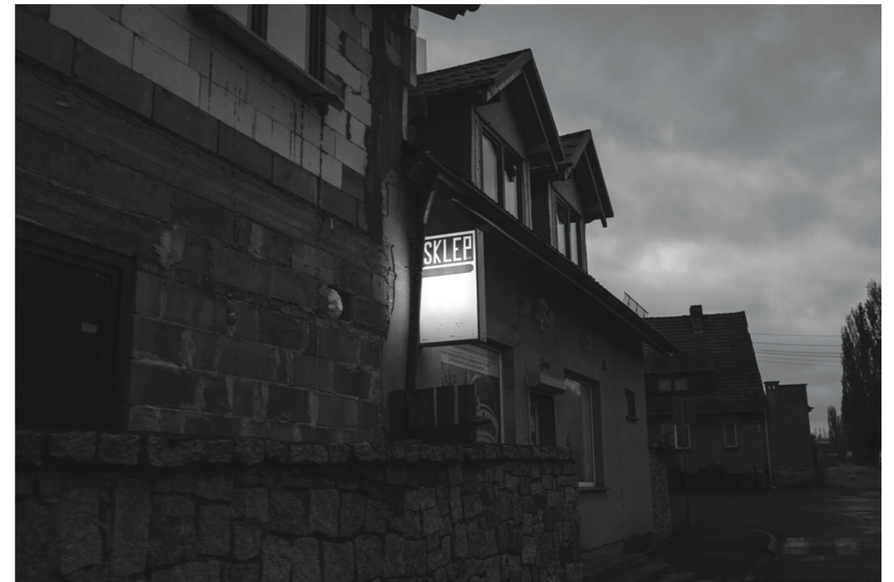
from „Mam, I came back home for a couple of days” Series