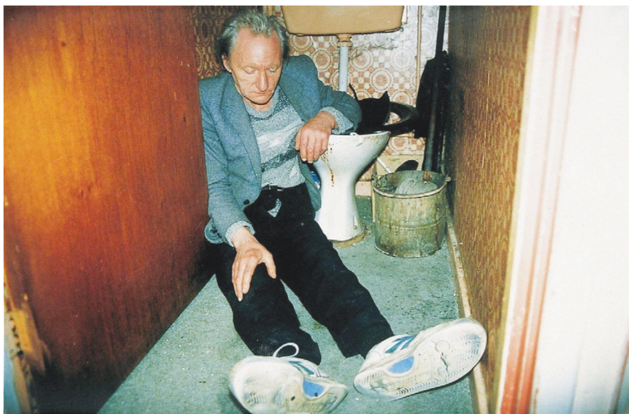
Photography: Richard Billingham, from „Ray's a Laugh” Series