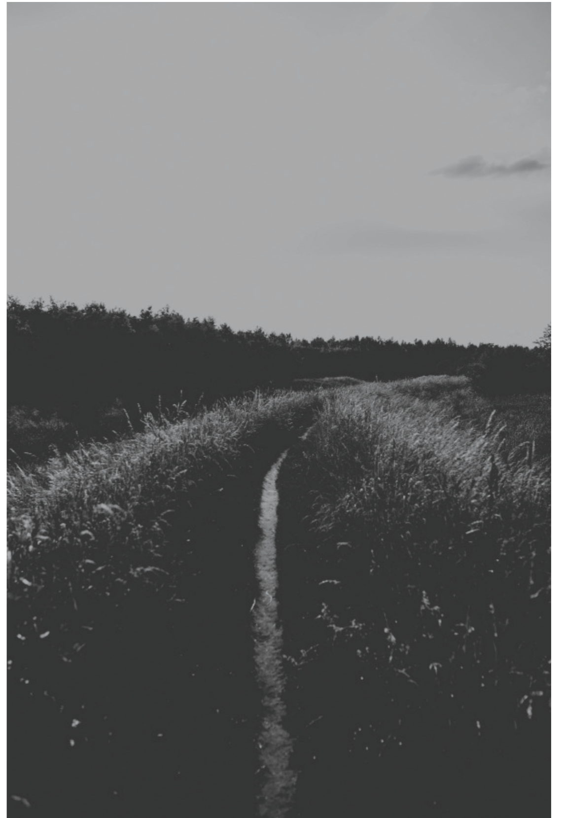
z cyklu „Nowy początek”