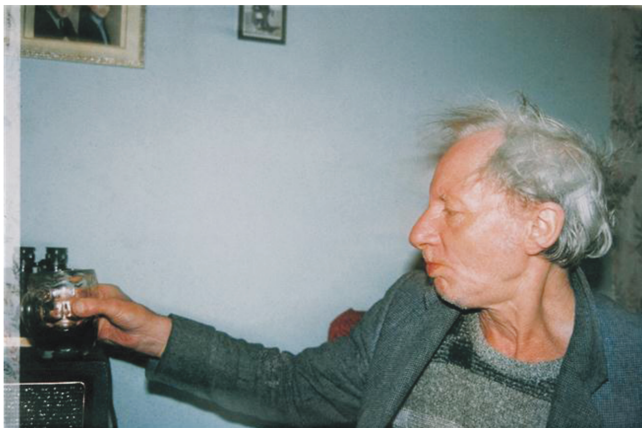
Photography: Richard Billingham, from „Ray's a Laugh” Series