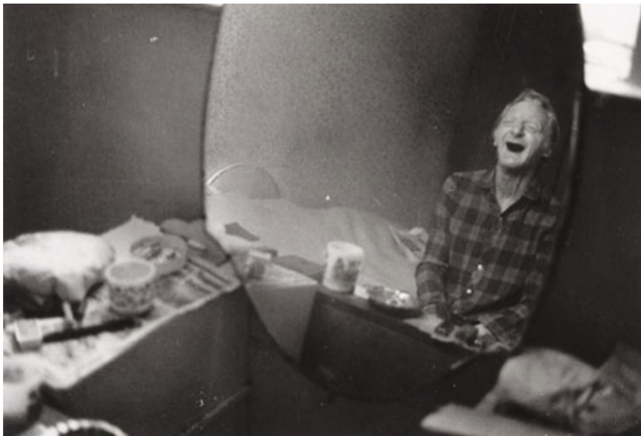
Photography: Richard Billingham, from „Ray’s a Laugh” Series

Na černobílé fotografii vidíme otce odrážejícího se v zrcadle v jeho bytě. Na první pohled není zřejmé, jestli se otec, sedící naproti zrcadlu, směje na sebe nebo sobě. Billinghamův otec se celé dny opíjel. Většina snímků z tohoto období ukazuje jeho pád. Stárnoucí muž, zničený nadměrnou konzumací alkoholu. Prostor ovládnutý zbytky jídla, prázdnými lahvemi. Billingham nevěnoval příliš pozornost kompozici. Jeho fotografie často ukazují pokřivené, neostře obrazy. Odmítl tradiční postoj fotografa dokumentaristy. Syn se díval s empatií a zaznamenával, co se děje s otcem separovaným od společnosti.