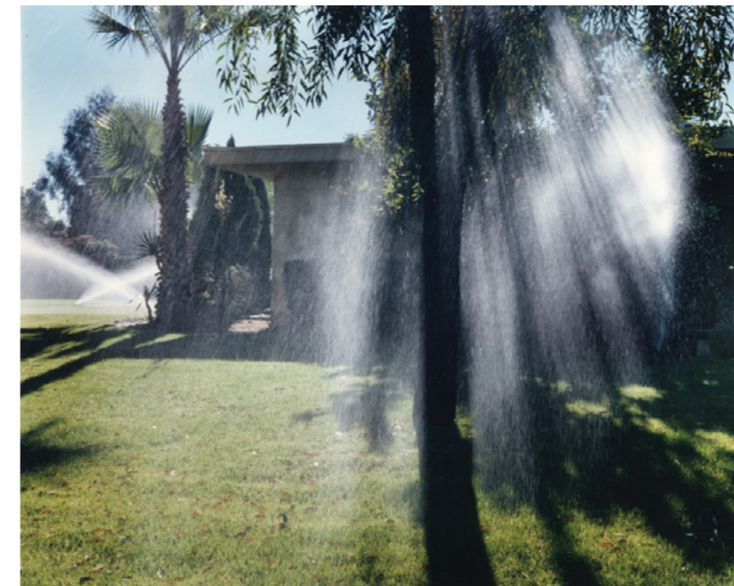
Photography: Larry Sultan, from „Pictures from Home“ Series