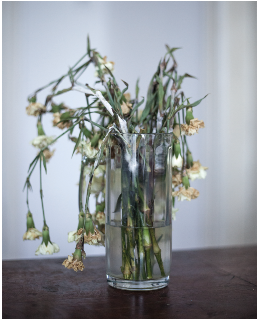
Photography: Krzysztof Orłowski, from „Returns” Series