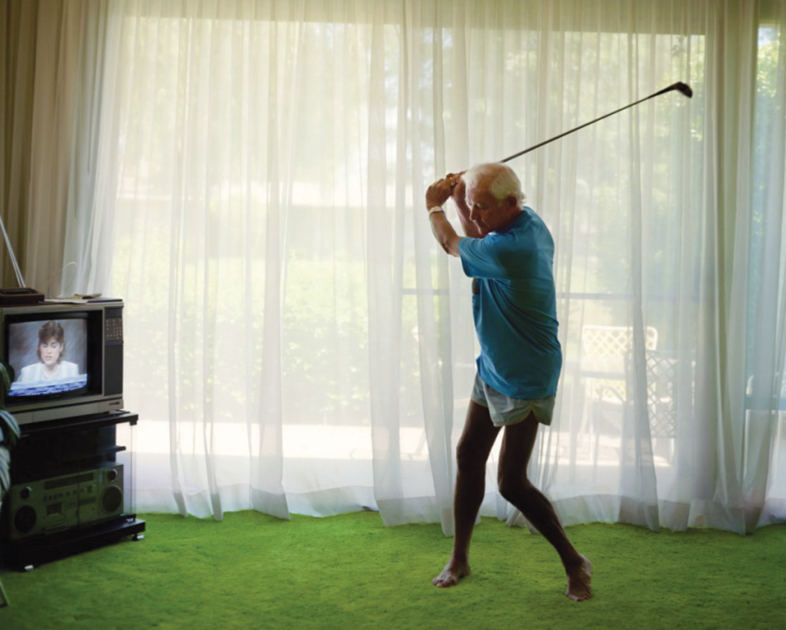
Photography: Larry Sultan, from „Pictures from Home“ Series

Larry Sultan začal otce a matku fotografovat na přelomu sedmdesátých a osmdesátých let. Dělat to deset let. Vypravěč ve filmu zpoza záběru doplňuje: