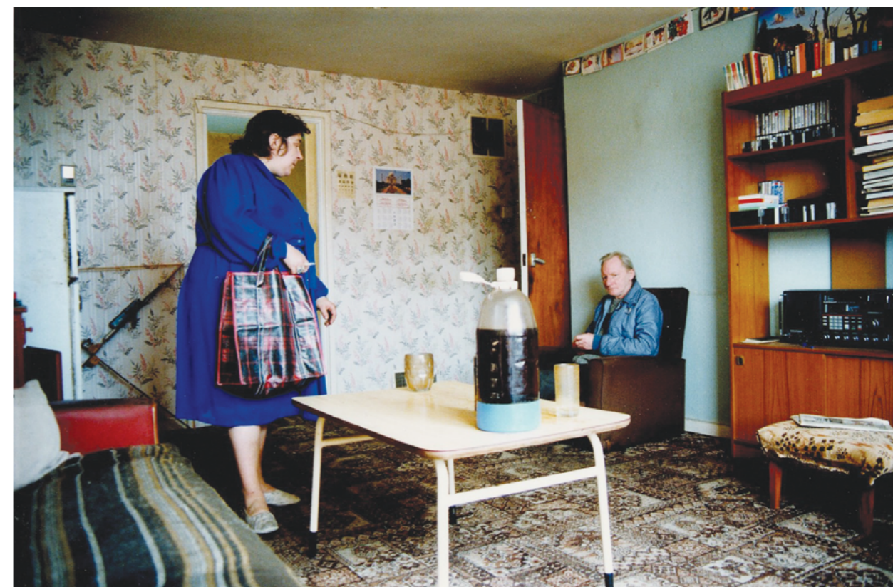
Photography: Richard Billingham, from „Ray's a Laugh” Series

Stačí běžné pozorování života, vůbec se nemusíme odkazovat na vědecké autority, abychom prohlásili, že si synové alkoholiků často také vytvoří závislost. Takovouto specifickou „generační štafetu” přímo a brutálně ukázal film Marka Koterského „Wszyscy jesteśmy Chrystusami” (Všichni jsme Kristové). Hlavní hrdinové, otec a syn, se potýkají s alkoholickými problémy. Syn od otce alkoholika dostává jasný příklad. Později ve vlastním dospělém životě schéma opakuje. Intelektuál alkoholik bojuje sám se sebou a se svou nemocí. Režisér ve svém filmu hrdiny obnažuje velmi přímo a bolestivě. Chybí zde prostor pro metafory a přimhouření oka.