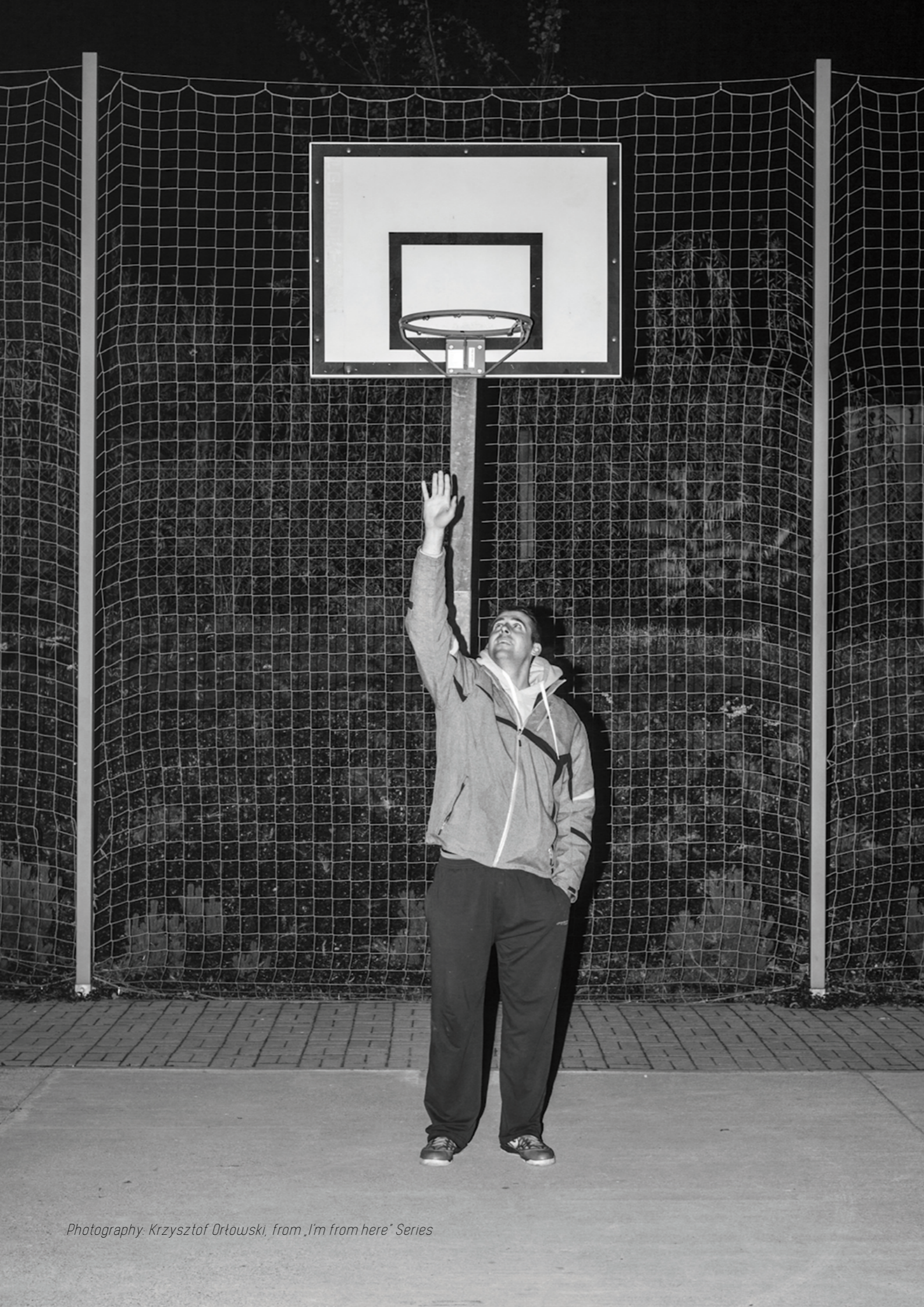
Photography: Krzysztof Orłowski, from „I'm from here” Series

Tento komplikovaný vztah mezi námi mě zformoval takového, jakým se cítím být. Skrytého, uzavřeného v sobě, ale citlivého. Během psaní této práce jsem si položil mnoho otázek. Rád bych vážně přistupoval k poselství, že je možné, abych bezpodmínečně pochopil, že za sebe, za můj vztah k jiným a k celému světu zodpovídám pouze já. Za to, co cítím, myslím a za to, co dělám - a mimo to nic není. Mohl bych přestat pěstovat si v sobě tento smutek k otci. Tento přístup mě odděluje od úplné radosti ze života, síly a pocitu důstojnosti.