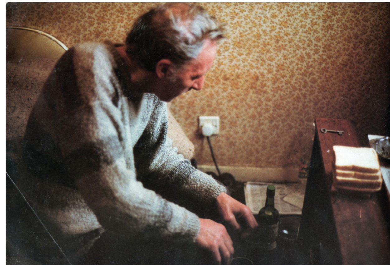
Photography: Richard Billingham, from „Ray’s a Laugh” Series

Na černobílé fotografii vidíme otce odrážejícího se v zrcadle v jeho bytě. Na první pohled není zřejmé, jestli se otec, sedící naproti zrcadlu, směje na sebe nebo sobě. Billinghamův otec se celé dny opíjel. Většina snímků z tohoto období ukazuje jeho pád. Stárnoucí muž, zničený nadměrnou konzumací alkoholu. Prostor ovládnutý zbytky jídla, prázdnými lahvemi. Billingham nevěnoval příliš pozornost kompozici. Jeho fotografie často ukazují pokřivené, neostře obrazy. Odmítl tradiční postoj fotografa dokumentaristy. Syn se díval s empatií a zaznamenával, co se děje s otcem separovaným od společnosti.