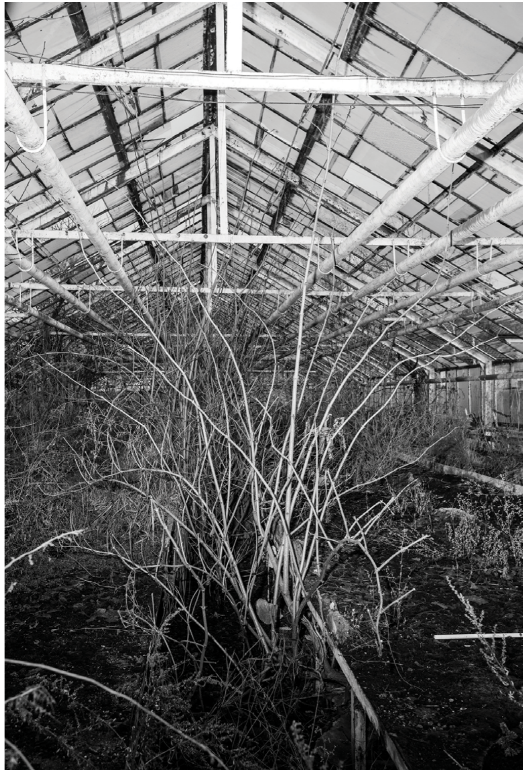
from „Mam, I came back home for a couple of days” Series

⚡ Podaří se mi někdy v mém „špatném otci” objevit jeho „dobrý a moudrý aspekt”? Podle všeho bych měl, abych poznal pravdu o svém mužském dědictví, poznat a nehodnotit. Otočit se a postavit se čelem k tomu stínu, který mě pronásleduje. Zkreslené vnímání. Extrémní emoce. Kvůli němu ztracená arkádie dětství. Právě proto jako fotograf vyprávím o nejbližší rodině. Jako bych chtěl uspokojit ten pocit smutku, zaplnit v sobě prázdné místo.