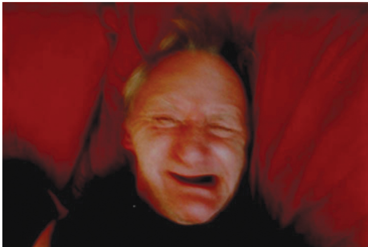
Photography: Richard Billingham, from „Ray’s a Laugh” Series