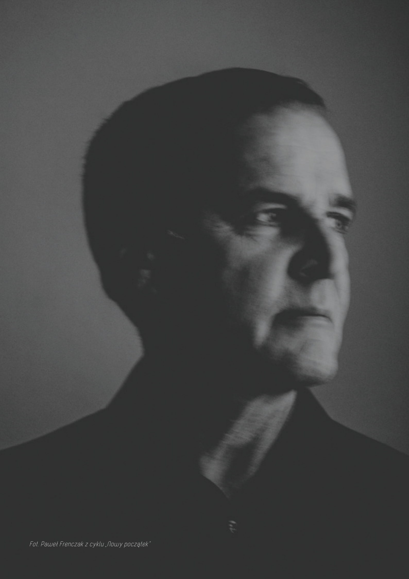
z cyklu „Nowy początek”