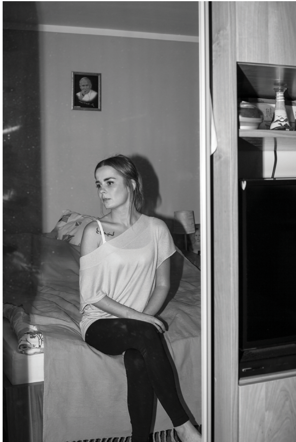
Photography: Krzysztof Orłowski, from „I'm from here“ Series

V posledním vyprávění věnovaném místu, z něhož pocházím, sobě a hrdinům, pokládám otázku: odkud jsi? Cyklus se jmenuje „Jestem stąd“ (Jsem odsud). Jde o soubor fotografií vyprávějících o identitě, o kořenech. Každý odněkud pochází. Nyní bydlím ve Vratislavi a pokud se mě někdo zeptá, říkám, že jsem ze Strzegomi. V cyklu portrétuji lidi z mého malého města v Dolním Slezsku. Ty, které si pamatují odjakživa, kteří celý život žili v mé čtvrti, a ty, kteří se kdysi odstěhovali, ale vrátili.