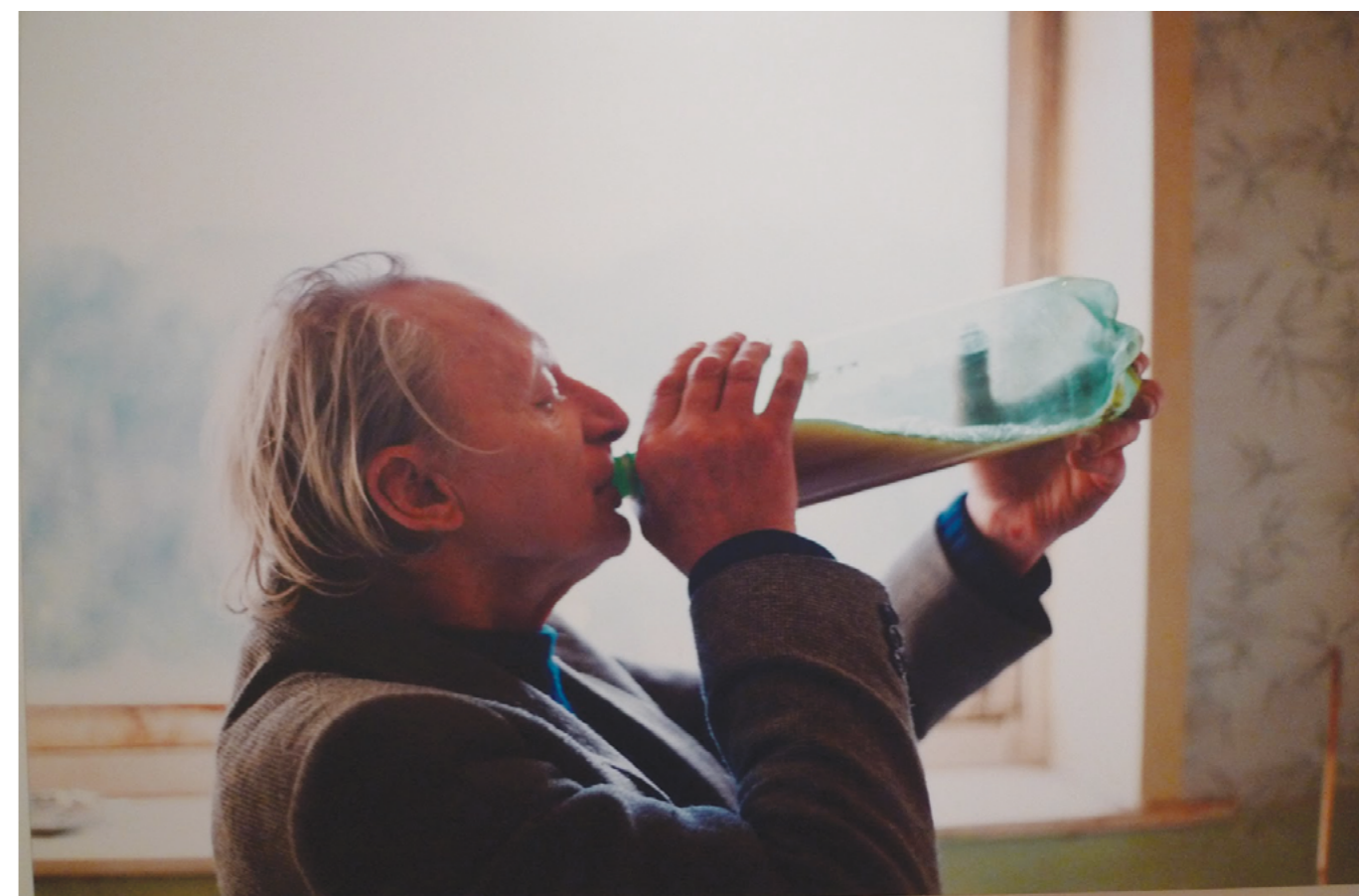
Photography: Richard Billingham, from „Ray’s a Laugh” Series

Richard fotografoval svou rodinu šest let od roku 1990. Jeho otec byl pravděpodobně na úspěch syna pyšný, ale v umění se nevyznal a jeho vášni nerozuměl.