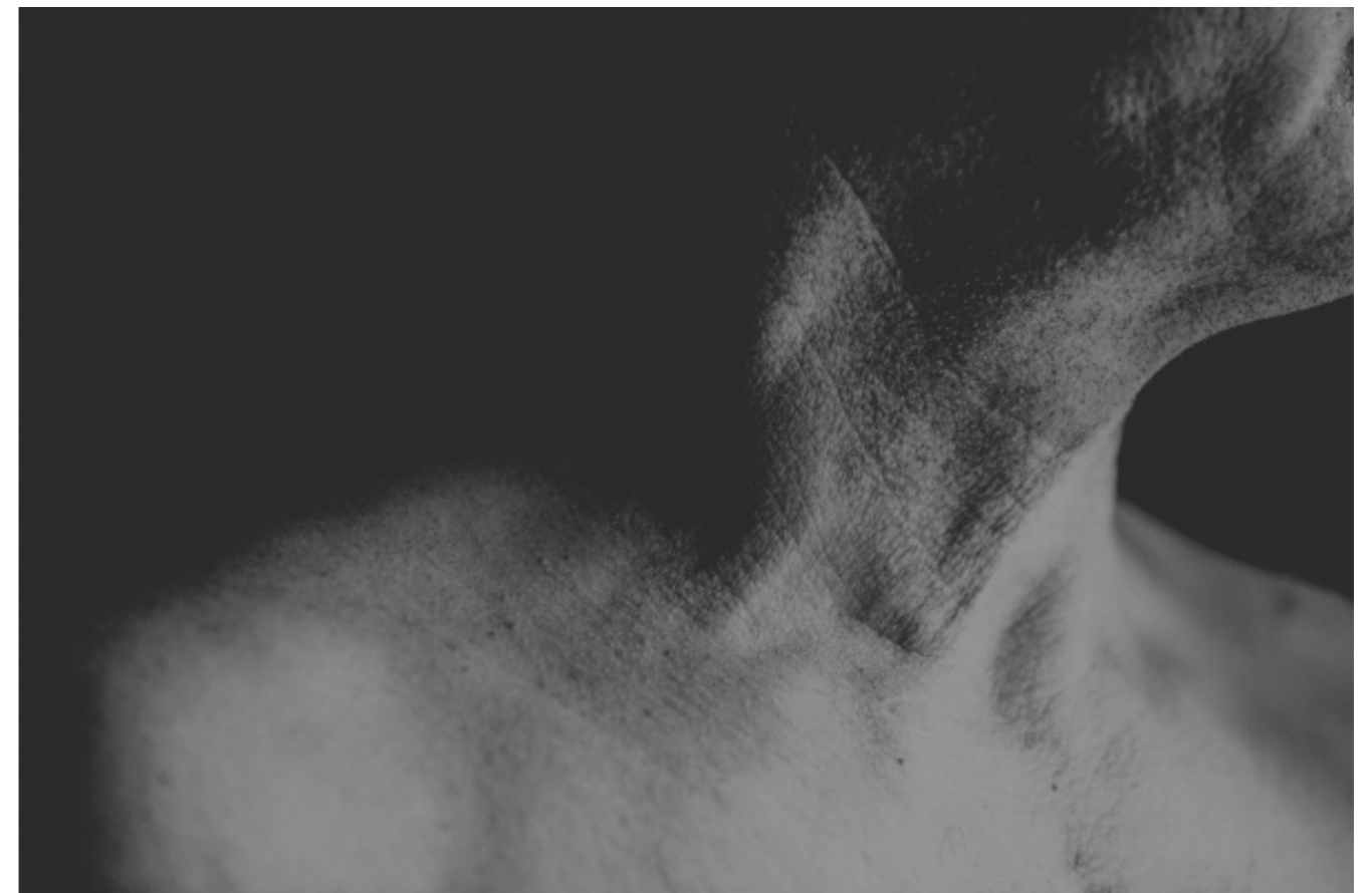
z cyklu „Nowy początek”