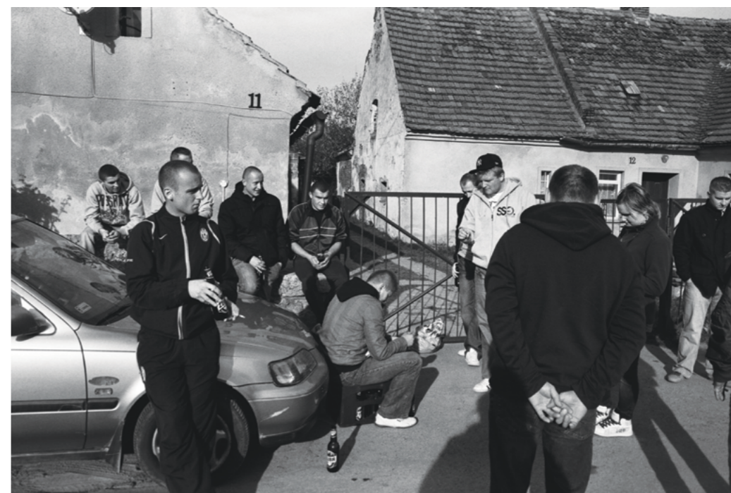
Photography: Krzysztof Orłowski, from „Province” Series