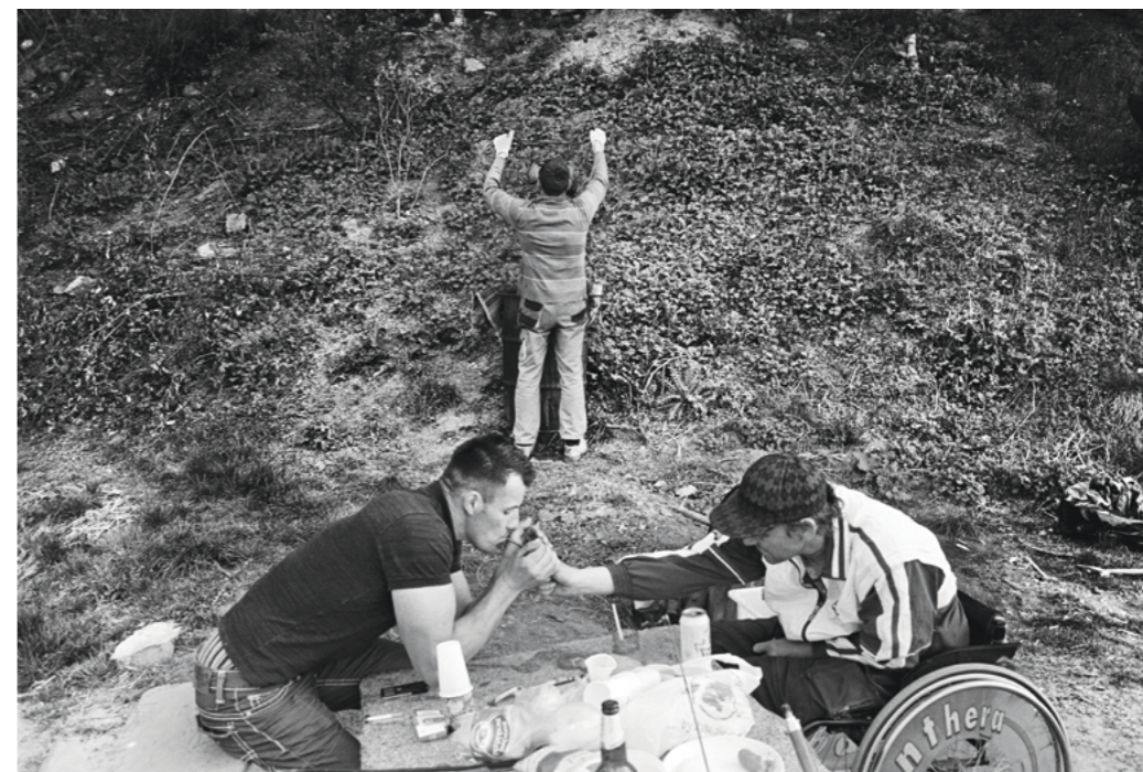
Photography: Krzysztof Orłowski, from „Province” Series

Během dalších let se jeho alkoholické onemocnění prohloubilo. Separoval se. Pil na několikátýdenních tazích. Neměl jsem odvahu se s ním setkat, když se nacházel v takovémto stavu. Čas od času jsme se potkali, když střízlivěl, a vždy na neutrální půdě. Jako u klasického alkoholika se v našich rozhovorech vyhýbal tématu své závislosti. V té době jsem pracoval na dalším cyklu o provincii, z níž pocházím, a samozřejmě o své rodině. Až tehdy, při shromažďování materiálu k práci, mě napadlo, proč jsem neudělal přímý, čistý otcův portrét. O čem to může vypovídat?