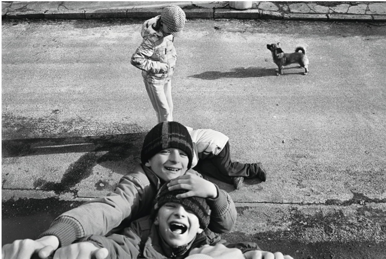
from „Province” Series

V sérii fotografií „Mamo, wróciłem na kilka dni” (Mami, na pár dní jsem se vrátil) se objevuje snímek bytu otce těsně po několikadenní pitce. Pouze jeho místo, on sám chybí. Jako v mém životě... Je tu tedy stůl, který tam stojí odjakživa, jenom občas změnil polohu. Na něm hrnek od kávy, popelník a jiné drobnosti. Lehce zamlžený pokoj. Zabírán ve stylu zátiší. Naše vztahy už byly vlastně skoro mrtvé. Navzájem jsme se vzdalovali čím dál víc. Už jsme neměli o čem mluvit, chyběla nám společná témata. Mou vášní se stala fotografie. Pohltila mě touha učit se a zdokonalovat technické postupy. Pro něj to bylo naprosto nesrozumitelné, jak jeho syn může „jen běhat a cvakat fotky”, místo toho, aby „pochtivě pracoval na opravách aut”?