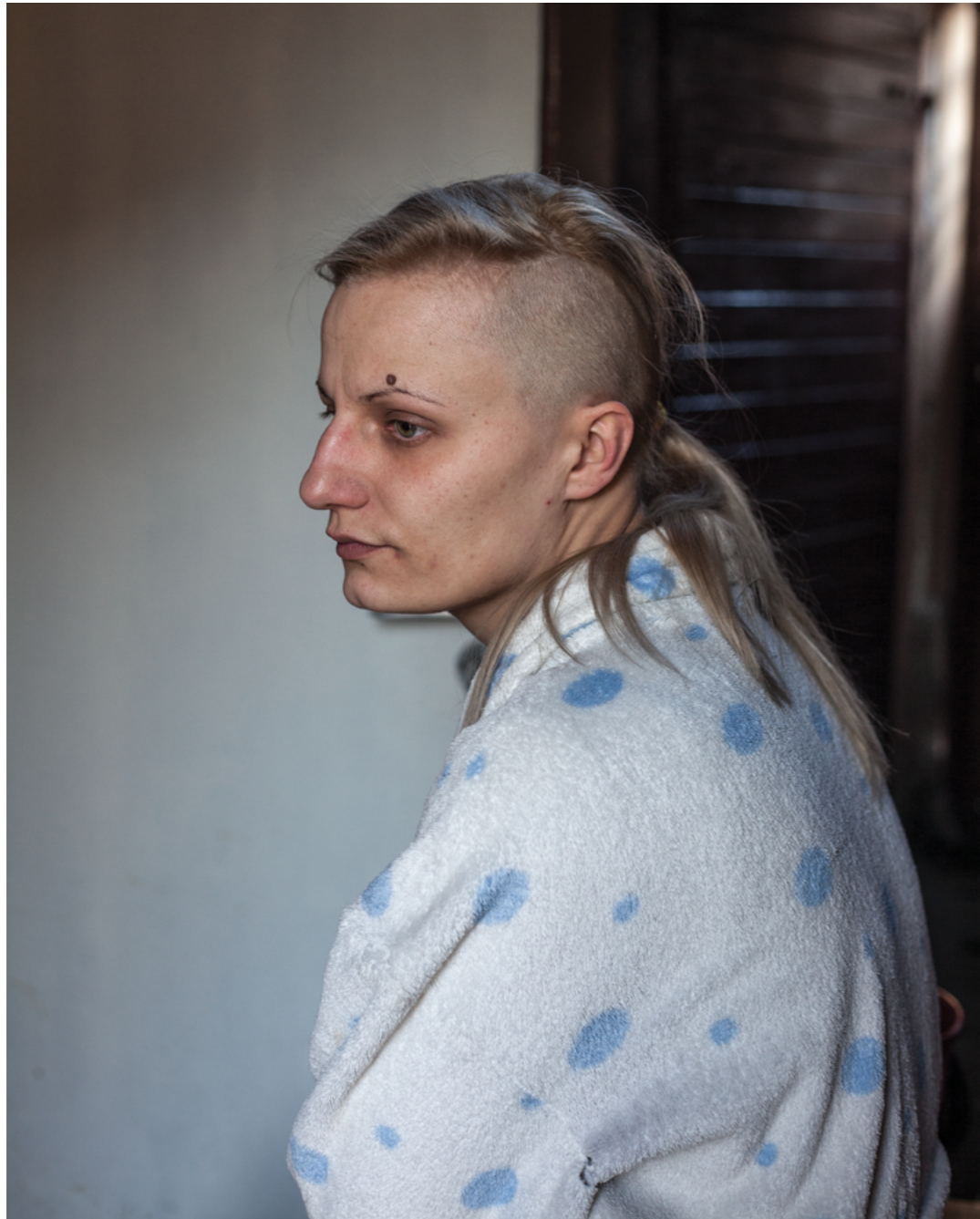
Photography: Krzysztof Orłowski, from „Returns” Series