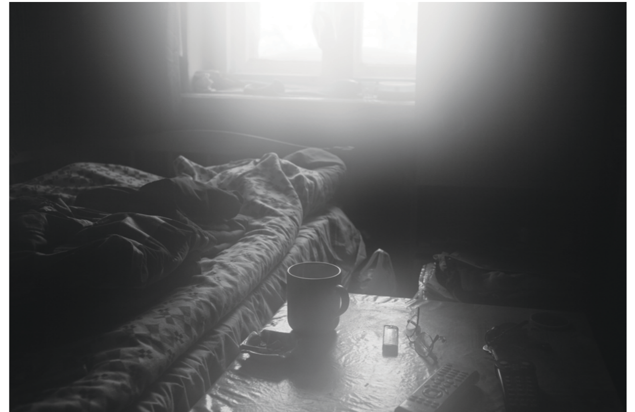
from „Mom, I came back home for a couple of days” Series