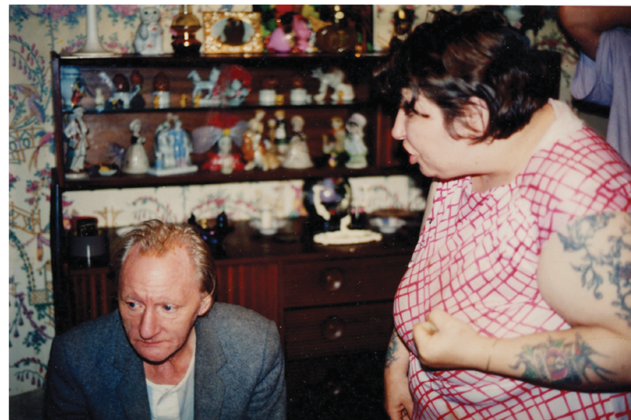
Photography: Richard Billingham, from „Ray's a Laugh“ Series

Fotografie Richarda Billinghama jsou působivé, ovlivňují nás svou upřímností a načrtávají problémy, které měl s otcem a matkou. Vypravěč filmu to komentuje: „Billinghamovy fotografie vytvářejí zvláštní rodinné album, jaké by žádná rodina nechtěla mít a už vůbec by ho nechtěla ukazovat. Chybí v něm vynucené úsměvy a rodinné oslavy. Připomíná spíš pohled na chaotickou zkoušku zpoza kulisy. Tato perspektiva proměnila nedostudovaného malíře ve známého fotografa“.